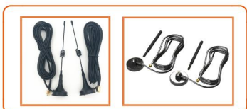
3.5dBi天线 或者 9dBi天线 每个终端配一根